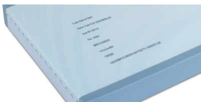
Tydlig märkning på skumkärna (och överdrag)