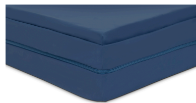
Överdrag med stabil dragkedja över 3 sidor